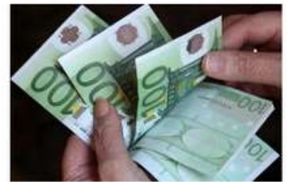
Če živite v Ljubljana, lahko dobite 2250 evrov na teden