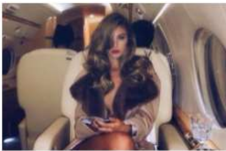
Mati samohranilka iz Kranja razkriva, kako z brezplačno aplikacijo zasluži 5400 evrov na teden

V policiji še vedno zaznavamo porast problematike z investicijskimi vlaganji v lažne spletne platforme. Problematika je začela izstopati že v letu 2020, ko je bilo obravnavanih 83 zadev s skupnim oškodovanjem v višini več kot dva milijonov evrov. Letos pa je bilo do konca avgusta obravnavanih že 115 zadev s skupnim oškodovanjem v višini več kot pet milijonov evrov! Vsem, ki jih mika obet hitrega zaslužka, zato v policiji svetujemo, naj bodo izjemno previdni in naj vsako tako "čudežno" ponudbo raje dobro preverijo.