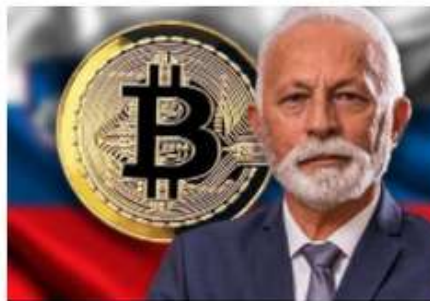
Nova platforma za trgovanje z Bitcoinom je vir za nove slovenske milijonarje